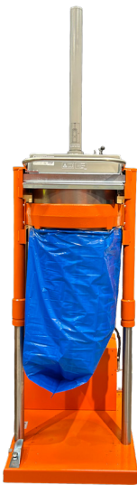
Tömningshöjd 2660 mm som standard

Det är lätt att fylla i material i den öppna toppmatade enheten. Komprimatorn är enkel och säker att manövrera och den inbyggda lyftfunktionen gör att det går snabbt att byta säck.