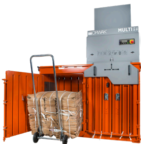
Fler band kan användas för att ta hand om utmanande material och uppfylla hårda hanteringskrav.

När balpressen komprimerar material i en kammare är den andra öppen och redo att matas med mer material!