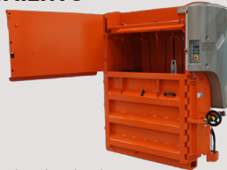
Compuerta regular para una altura de instalación ultrabaja.