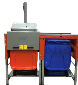
La unidad con varias cámaras tiene una plataforma con dos asas