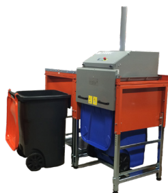
Diseñado para contenedores estándar de 360 L del mercado.

¡El modelo 4360 es más fácil de usar! La versión con varias cámaras es una instalación cómoda de carga superior y la versión de cámara única funciona con la fácil operación de empujar y sacar el contenedor. La seguridad y la calidad son nuestras señas de identidad y el compactador ofrece la máxima seguridad personal tanto para el operador como para las personas que se encuentren en las inmediaciones. Un indicador de contenedor garantiza que la máquina solo se pueda poner en marcha cuando el contenedor esté en la posición correcta.