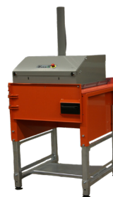
La unidad con cámara única tiene puerta abatible

El compactador se puede ampliar fácilmente con más cámaras adicionales. La puerta delantera de la unidad de cámara única se sustituye por una plataforma para el movimiento sin esfuerzo del cabezal de compresión de una cámara a la siguiente.