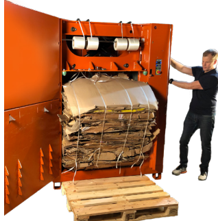
Simplemente presione dos botones para expulsión de balas