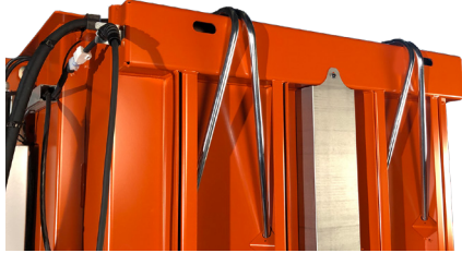
Tubos para un fácil flejado de la bala

La compactadora es rápida, con un tiempo de ciclo de tan solo 16 segundos, está lista para una nueva carga de cajas de cartón o plásticos en un momento. ¡Además, el arranque automático es una función estándar! Puede operar la 3220 manualmente, pero es preferible usarla en modo automático para mayor comodidad y la máxima productividad.