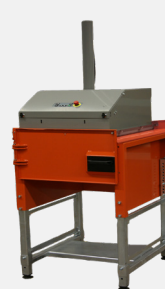
L'unité à chambre unique avec une porte pivotante.

Le compacteur est évolutif grâce à l'ajout possible des chambres supplémentaires. La porte avant de l'unité à chambre unique est alors remplacée par un tablier pour faciliter un mouvement aisé de la tête de compactage d'une chambre à l'autre.