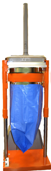
Altura de vaciado de 2.660 mm de serie

Es fácil introducir materiales en la unidad de carga superior abierta. La compactadora es segura y fácil de manejar y la función de elevación integrada permite cambiar la bolsa de forma rápida y cómoda.