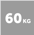
BALLEN- GEWICHT KARTONAGE