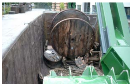
Fyllning kan ske under drift

Genom den kontinuerliga rullande rörelsen med den tunga packningstrumman bryts, slits och komprimeras det material som kastas in så att upp till fem gånger mängden avfall kan rymmas i en container.