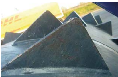
Kraftig trumma med rejäla taggar