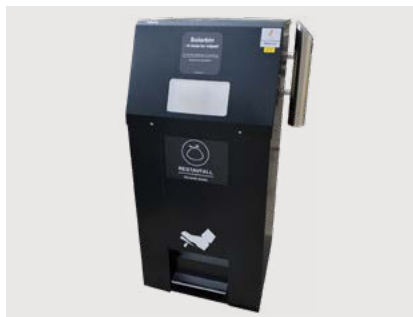
Avfallsbehållare med solpanel och komprimering