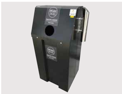
Tillhörande avfallsbehållare utan solpanel eller komprimering