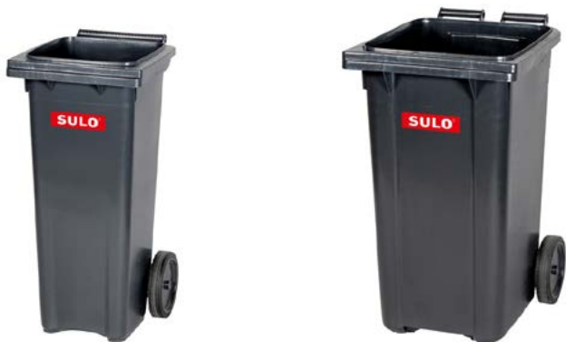
Avfallet komprimeras direkt i tvåhjuls standardbehållare å 120 eller 240 liter

av galvaniserat stål med härdad pulverlackering på ytan. Kan behandlas med "antitagning". Behållaren har ett dörrlås och inkasthålet kan justeras efter behov.