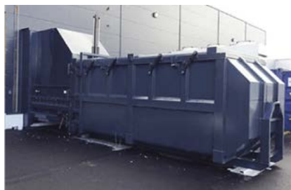
Inkasttratt med vägganslutning.