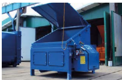
Inkast från mark med låsbart lock.

minskar antalet transporter avsevärt. Kompressorerna är förberedda för att kunna kombineras med alla vanliga lyftanordningar.