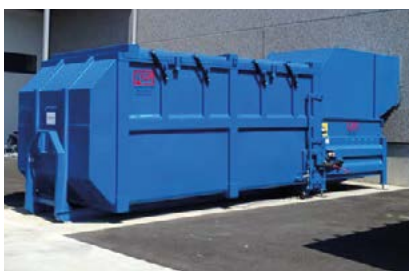
Inkasttratt med vägganslutning.