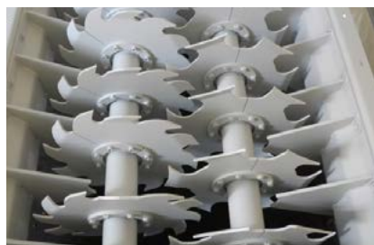
Shredder ZR 1380

inkast, men tar trots det inga större ytor i anspråk. De arbetar på ett ekonomiskt och driftsäkert sätt och med hjälp av intelligent styrning.