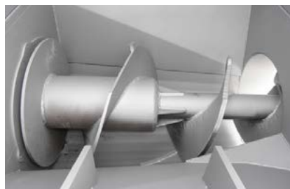
Inkast med skruv.