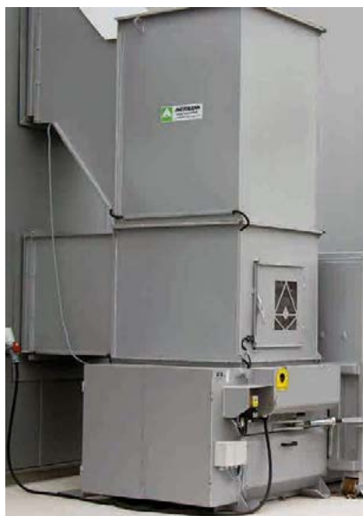
Inkast med vägganslutning från två plan.