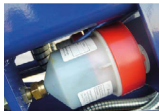
Automatisk smörjning av leder