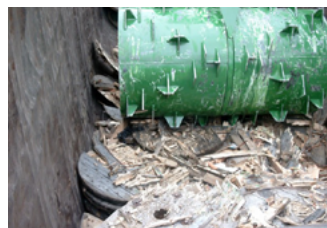
Maskinen sliter sönder materialet