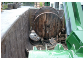
Fyllning kan ske under drift