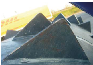
Kraftig trumma med rejäla taggar