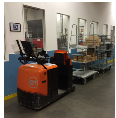
Det elektriska fordonet kör in komponenter och transporterar ut balarna ur fabriken.