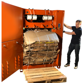
Det är enkelt att trycka på två knappar för urbalning!