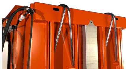
Rör underlättar banddragningen.

3220 är mycket snabb och med en cykeltid på bara 16 sekunder, är den genast redo för en ny laddning kartonger eller plast! Autostart är en standardfunktion som gör användningen både bekvämare och mer produktiv även om maskinen givetvis kan köras manuellt också.