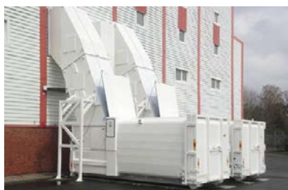
Inkast med vägganslutning från övre plan.