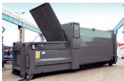
Inkast från mark med låsbart lock.

Transportfrekvensen och därmed transportkostnaderna kan reduceras markant. Den speciella formen på komprimatorerna underlättar påtagligt tömningen.