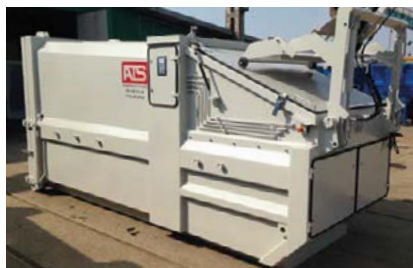
Liftdumper med integrerad kärlvärdare.