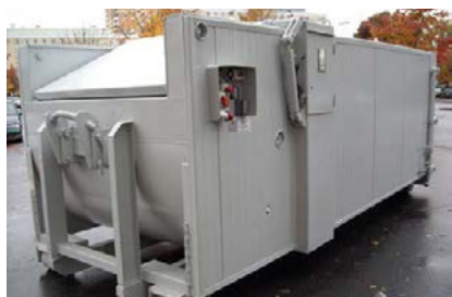
Kylaggregat med isolering.