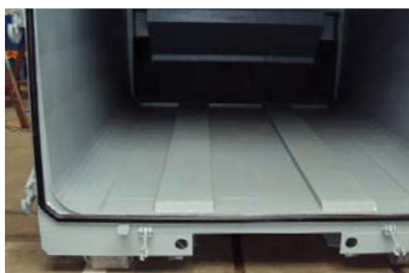
Tät baköppning med extra låsningar.