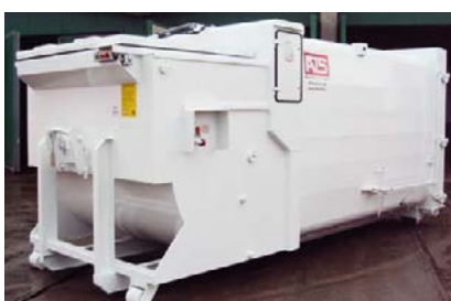
Inkast från kaj med hydrauliskt lock.