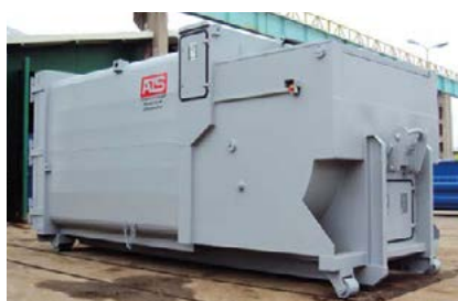
Container med bottenvärme.

Pendelkomprimatorn passar utmärkt för verksamheter där blött avfall genereras. Några exempel är sjukhus, vårdhem, äldreboenden, hotell, storkök, storskalig cateringverksamhet, livsmedelsindustri och marknadsplatser.