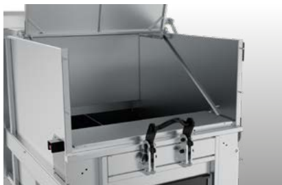
Väl tilltaget inkast