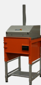
Enkelkammarsversion med svängdörr

Maskinen är lätt att bygga ut med fler kamrar vid behov. Framdörren i enkelkammarsversionen byts då ut mot ett förkläde för enkel förflyttning av pressenheten från kammare till kammare i flerkammarsversionen.