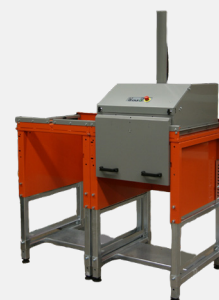
Flerkammarsversion utrustad med ett förkläde med två handtag