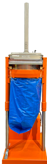
Tömningshöjd 2660 mm som standard

Det är lätt att fylla i material i den öppna toppmatade enheten. Komprimatorn är enkel och säker att manövrera och den inbyggda lyftfunktionen gör att det går snabbt att byta säck.